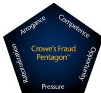
Gambar 2.1. Crowe's Fraud Pentagon

Sumber: The Crowe's Fraud Pentagon (Crowe Horwarth 2011)