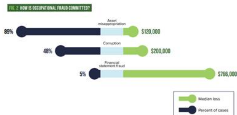
Gambar 1.1. Fraud yang paling banyak terjadi dan rata-rata kerugian